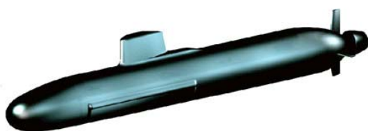
Sous-marin type Barracuda