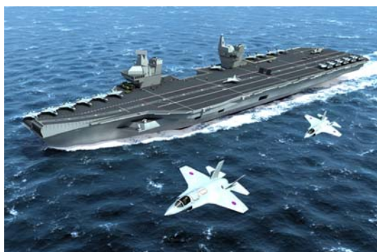
Vue du futur CVF Britannique dont dérivera le PA2