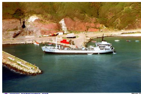
La Punaruu à Ua Pou ( Marquises ) en 1990