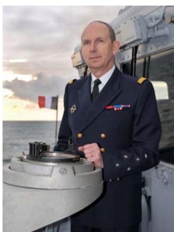
Début février, l'Amiral Pierre-François Forissier a pris les fonctions de Chef d'état-major de la Marine.

La Marine nationale a un nouveau « pacha », un nouveau second, et un nouveau délégué aux réserves.